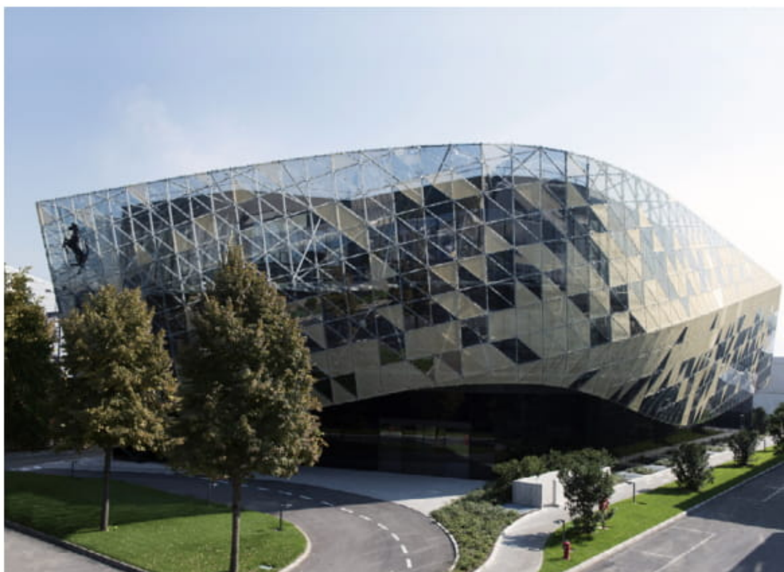
Ferrari Centro Stile, Maranello